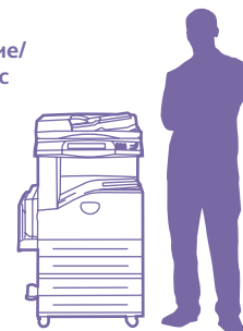
Система WorkCentre 5222 с двухлотковым модулем подачи бумаги